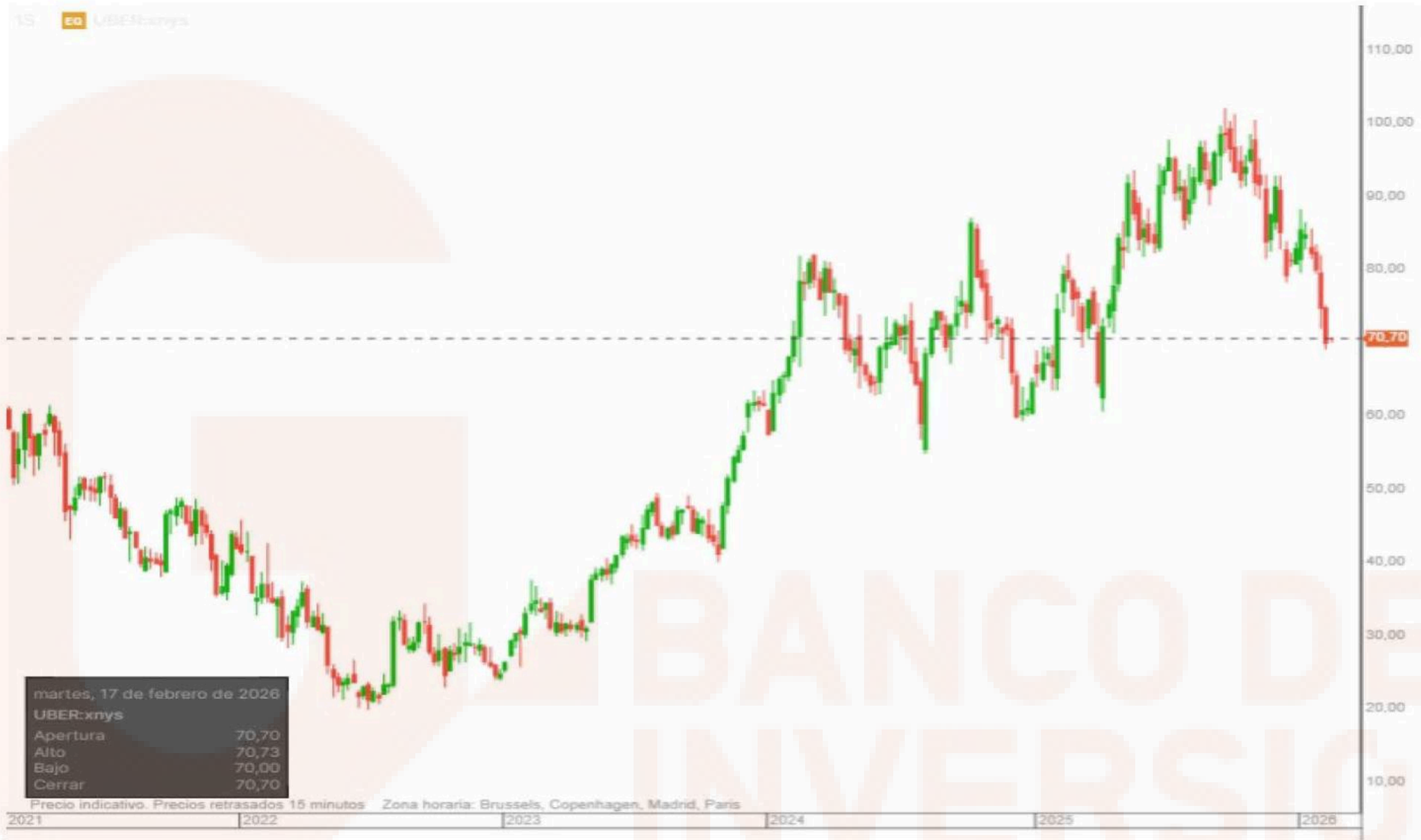
Gráfico de la plataforma de inversión de Banco BiG, velas diarias. Indicadores medias móviles sencillas, en negro media 50 sesiones en gris media de 200 sesiones.