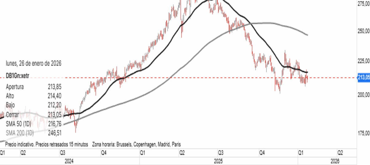
Gráfico de la plataforma de inversión de Banco BiG, velas diarias. Indicadores medias móviles sencillas, en negro media 50 sesiones en gris media de 200 sesiones.