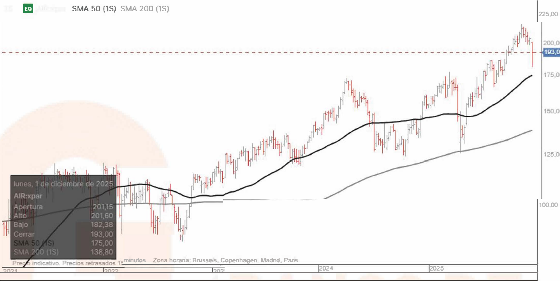
Gráfico de la plataforma de inversión de Banco BiG, velas diarias. Indicadores medias móviles sencillas, en negro media 50 sesiones en gris media de 200 sesiones.