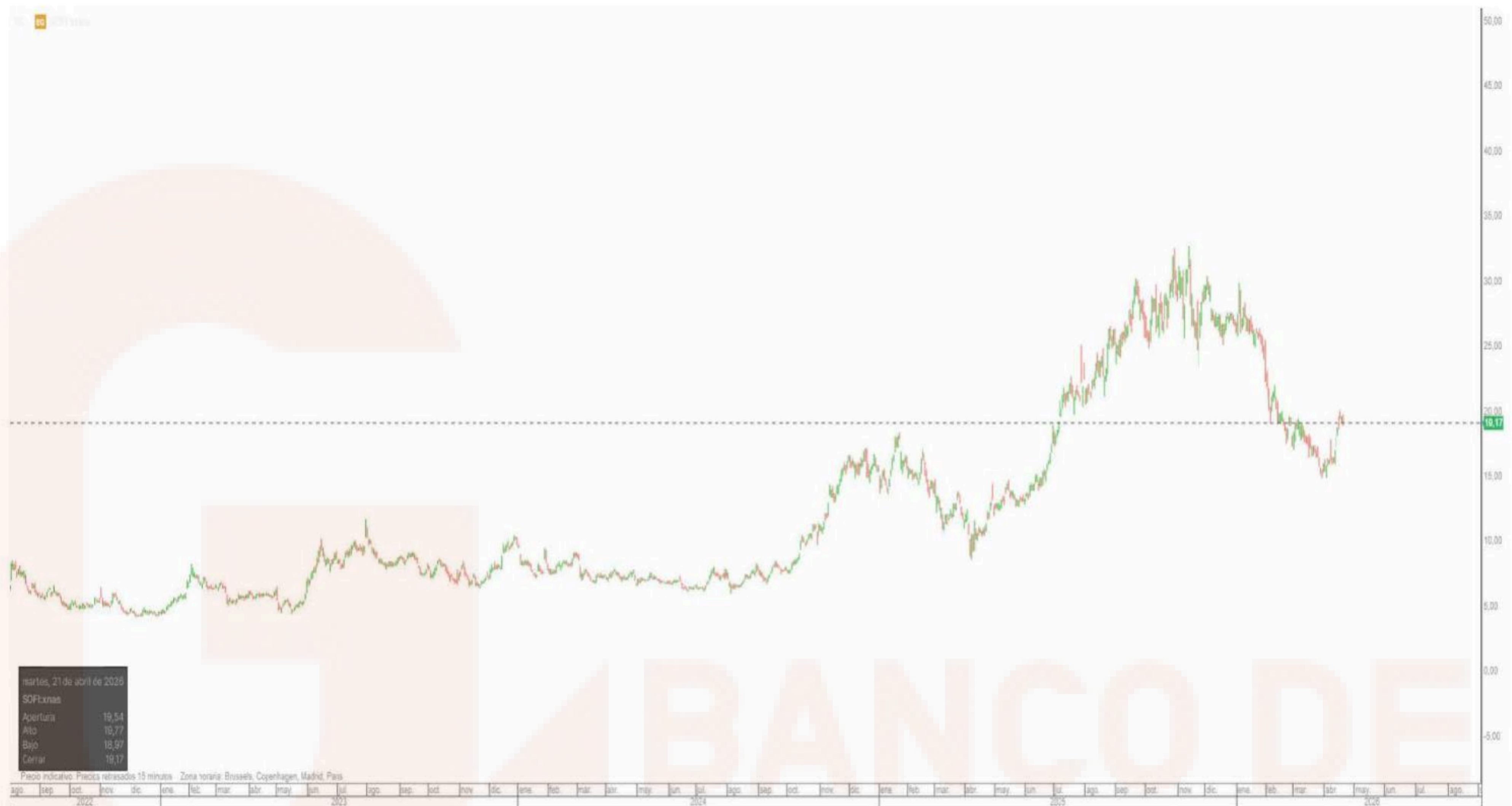
Gráfico de la plataforma de inversión de Banco BiG, velas diarias. Indicadores medias móviles sencillas, en negro media 50 sesiones en gris media de 200 sesiones.