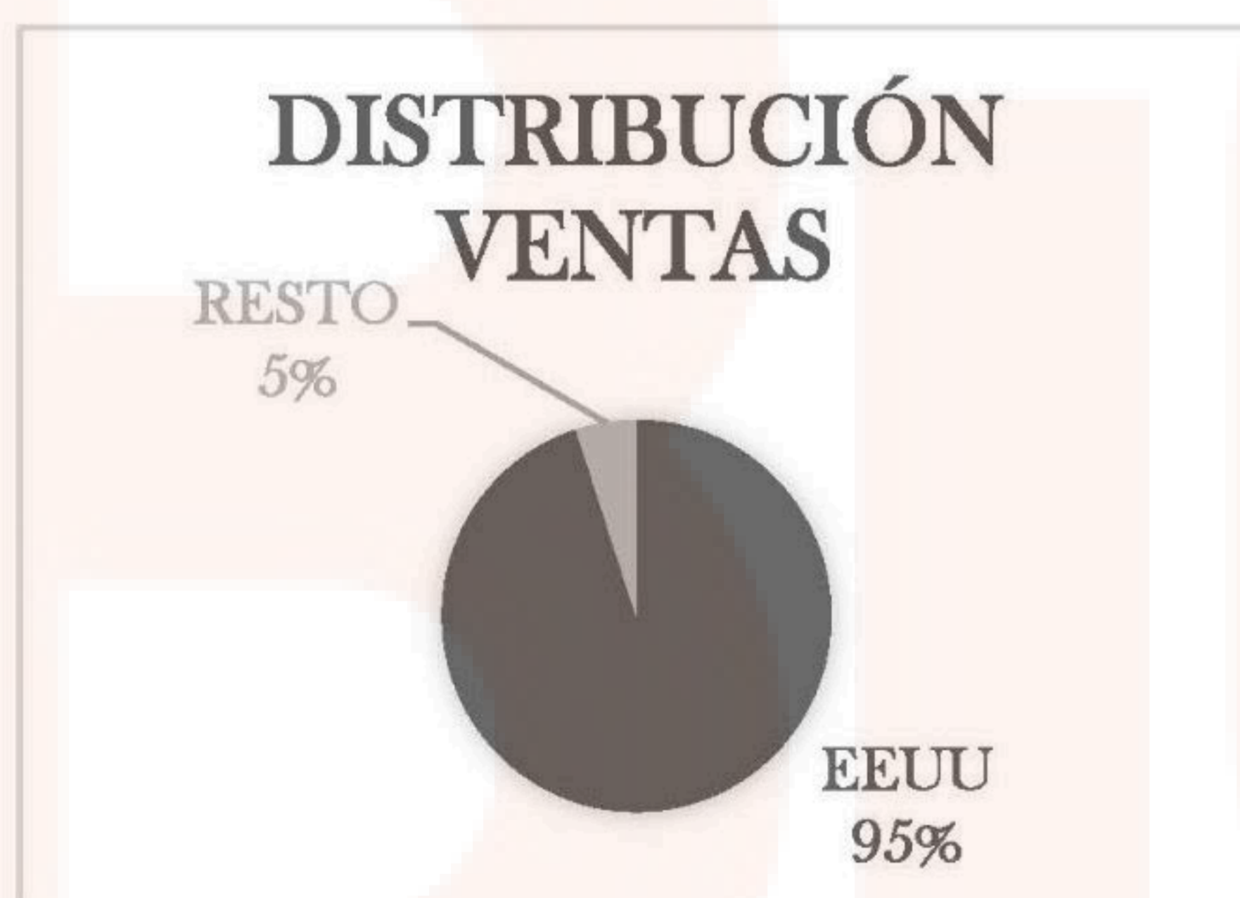
Gráfico circular en el cual se muestra la distribución de ventas de la compañía por geografías al cierre del ejercicio 2025.