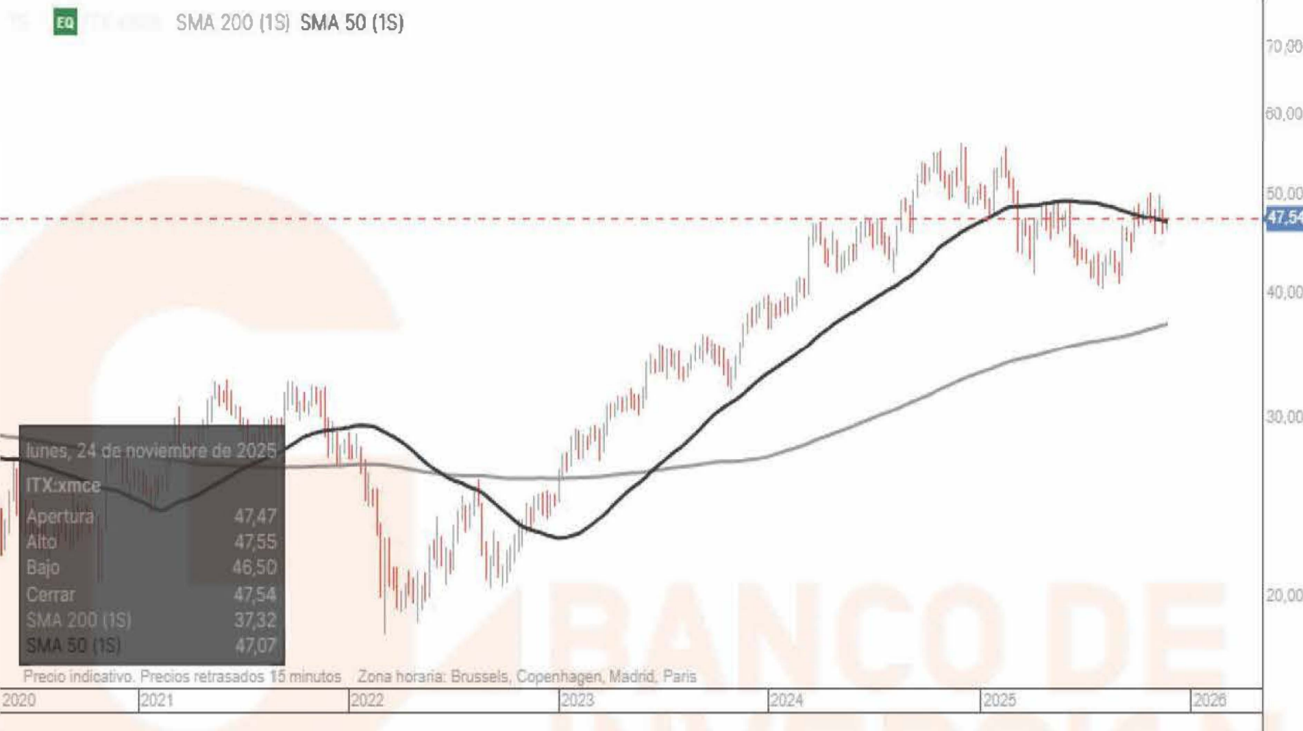
Gráfico de la plataforma de inversión de Banco BiG, velas diarias. Indicadores medias móviles sencillas, en negro media 50 sesiones en gris media de 200 sesiones.

Gráfico circular en el cual se muestra la distribución de ventas de la compañía por geografías al cierre del ejercicio 2024.