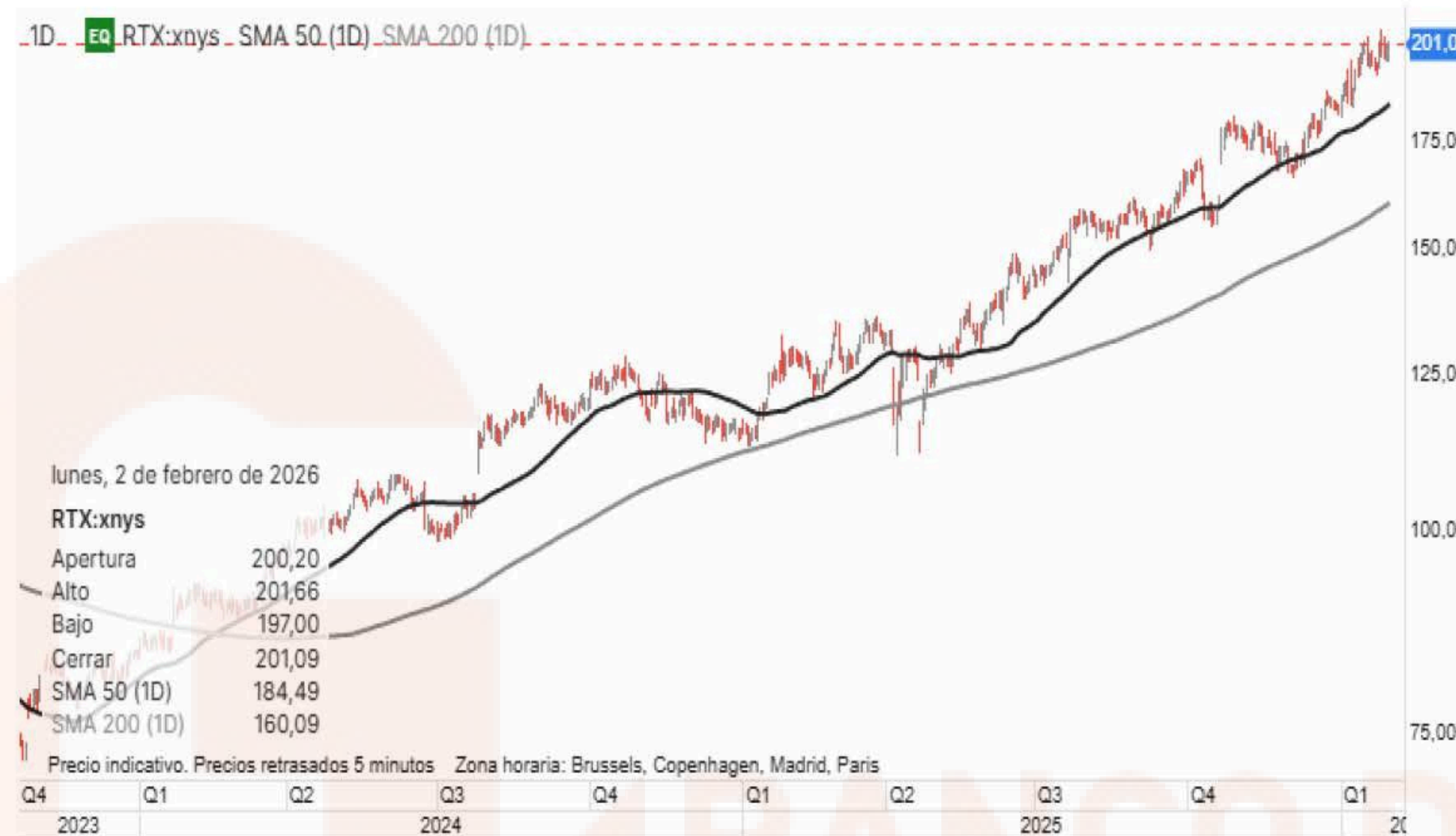
Gráfico de la plataforma de inversión de Banco BiG, velas diarias. Indicadores medias móviles sencillas, en negro media 50 sesiones en gris media de 200 sesiones.