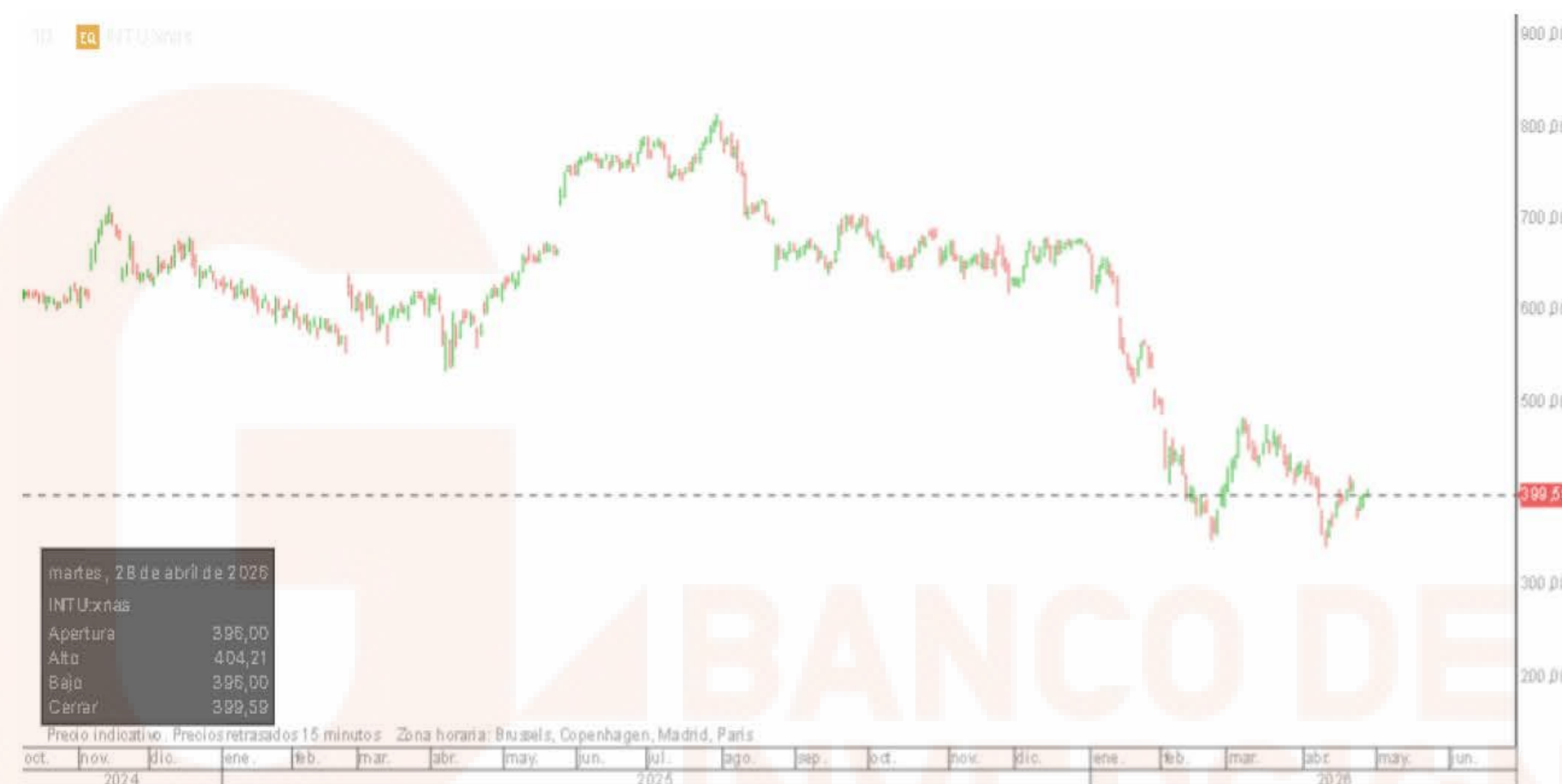
Gráfico de la plataforma de inversión de Banco BiG, velas diarias. Indicadores medias móviles sencillas, en negro media 50 sesiones en gris media de 200 sesiones.